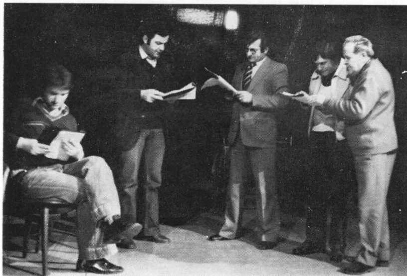
Aranžirna vaja na odru