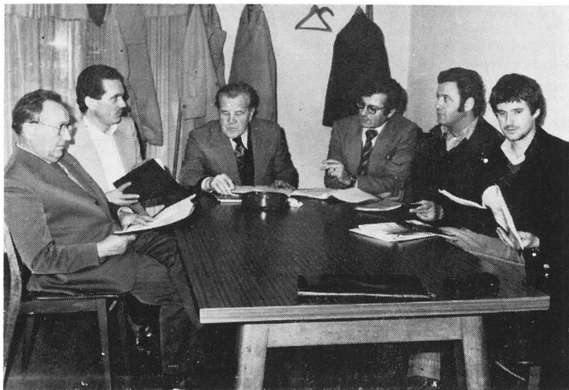
Bralna vaja za mizo