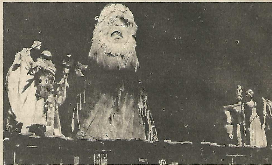
Na festivalu so sodelovali tudi lutkarji iz Plzna s predstavo Jan Žížek na dvorcu Rabi.

Pariz je strašno veliko mesto. Samo v ožjem centru mesta živi kar precej več prebivalcev, kot jih šteje Slovenija. Pariz je tudi zelo staro mesto, saj so Galci na otočku sredi Seine postavili naselje že v prazgodovinski dobi.