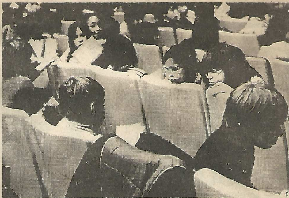
Vaši francoski vrstniki med predstavo